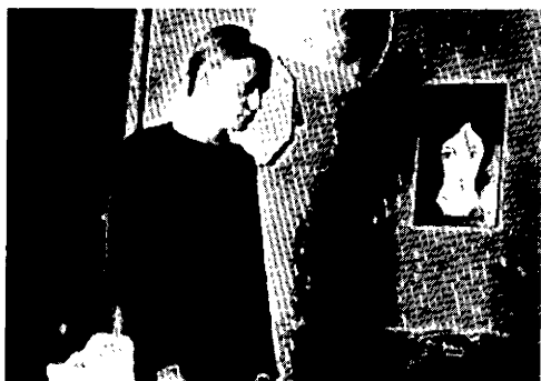
La coupe à 10 francs